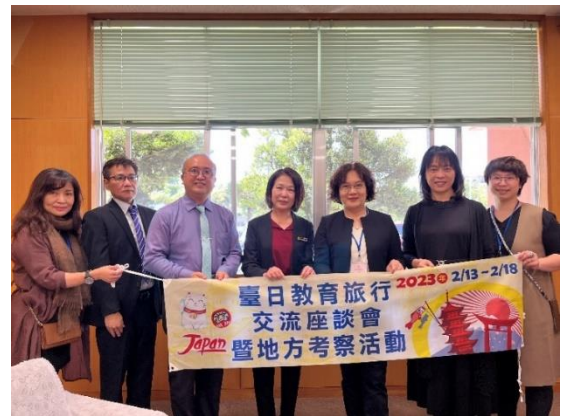
▲具志川商業高校訪問(2月16日)