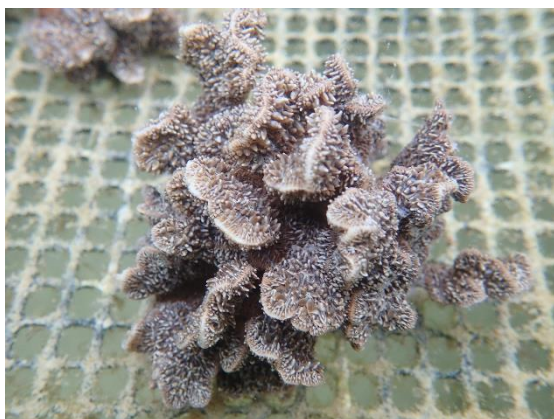
▲シコロサンゴ参考写真