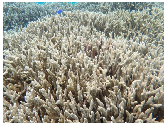
▲エダコモンサンゴ参考写真