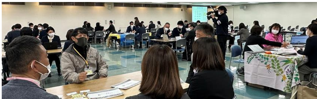
▲各出展事業者 個別相談ブースの様子(令和5年1月31日)