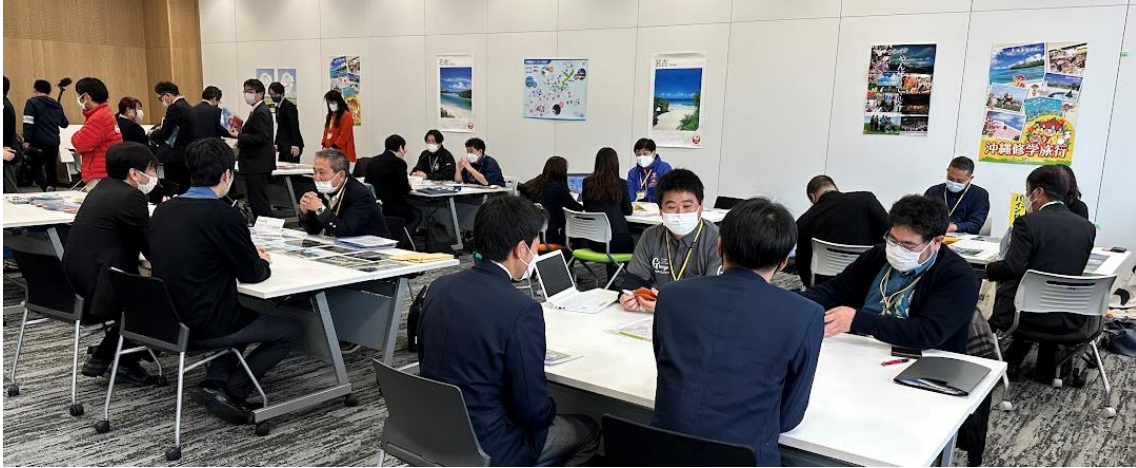
▲各出展事業者 個別相談ブースの様子(令和5年2月2日)