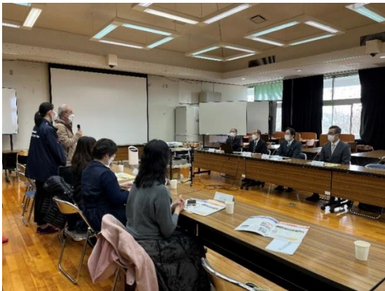
▲向陽高校訪問(2月15日)