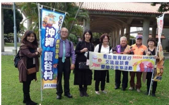
▲民泊ホームビジット入村式(2月16日)