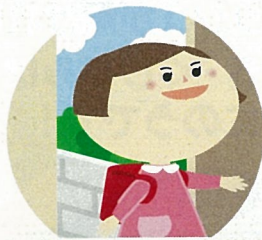
外から帰ったあと