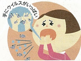
咳やくしゃみを手で おさえてしまったあと